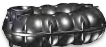
NEO 5.000 Liter