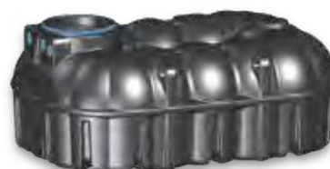
NEO 7.100 Liter